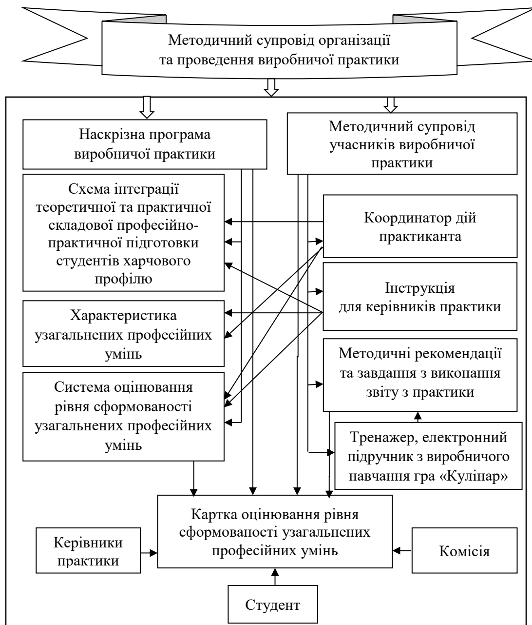
Рис. 2. Схема методичного інструментарію організації та проведення виробничої практики

До методичного супроводу увійшла наскрізна програма з виробничої практики (першої та другої виробничих, першої та другої технологічних, педагогічних), методичний супровід учасників виробничої практики, схема інтеграції теоретичної та практичної складової професійно-практичної підготовки майбутніх фахівців, система оцінювання рівня узагальнених професійних умінь. Методичний супровід учасників виробничої практики складається з координатора дій практиканта, інструкції для керівників практики, методичних рекомендацій та завдань з виконання звіту з