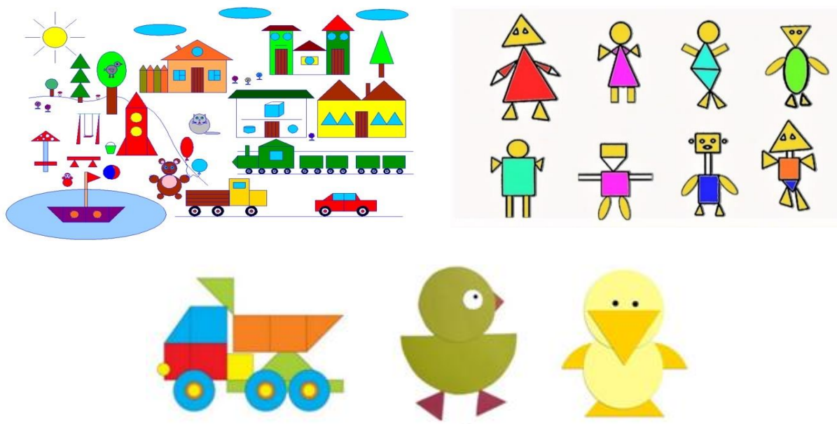
Рис. 2. Картини, намальовані з використанням вивчених фігур

Зазначимо, що для молодших школярів це наче гра, діяльність у сенсі грецького пайдея, тобто заради самої дитини, а не лише з метою вивчення предмета чи свідомого розвитку естетичної компетентності. Гра є важливою складовою розвитку дитини, яка готує її до життя і завжди має елементи напруги. Учитель виходить з того, що навчальна гра не лише надає знань та свідомо спрямована на виховання певної компетентності, вона ще й захоплює дитину. Отже, через специфічний метод пізнання і передачу знань про геометричні фігури, завдяки мистецтву педагог розвиває емоційно-образну форму мислення школярів і контент навчання «проживається» учнями емоційно завдяки запропонованій діяльності.