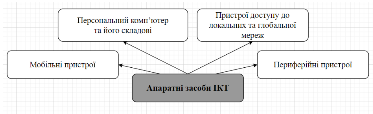
Рис. 1. Класифікація апаратних засобів ІКТ (розроблено автором)

На нашу думку, на сучасному етапі розвитку освіти значне місце, зокрема через інтенсифікацію дистанційного та змішаного навчання, займають ще й такі засоби як смартфони, планшети, електронні книги тощо, і їх потрібно окремо віднести до апаратних засобів (віднесемо їх у категорію мобільні пристрої). Тому вважаємо, що апаратні засоби навчання складають персональний комп'ютери чи ноутбуки, мобільні пристрої, пристрої доступу до локальних та глобальної мереж, периферійні пристрої (рис. 1).