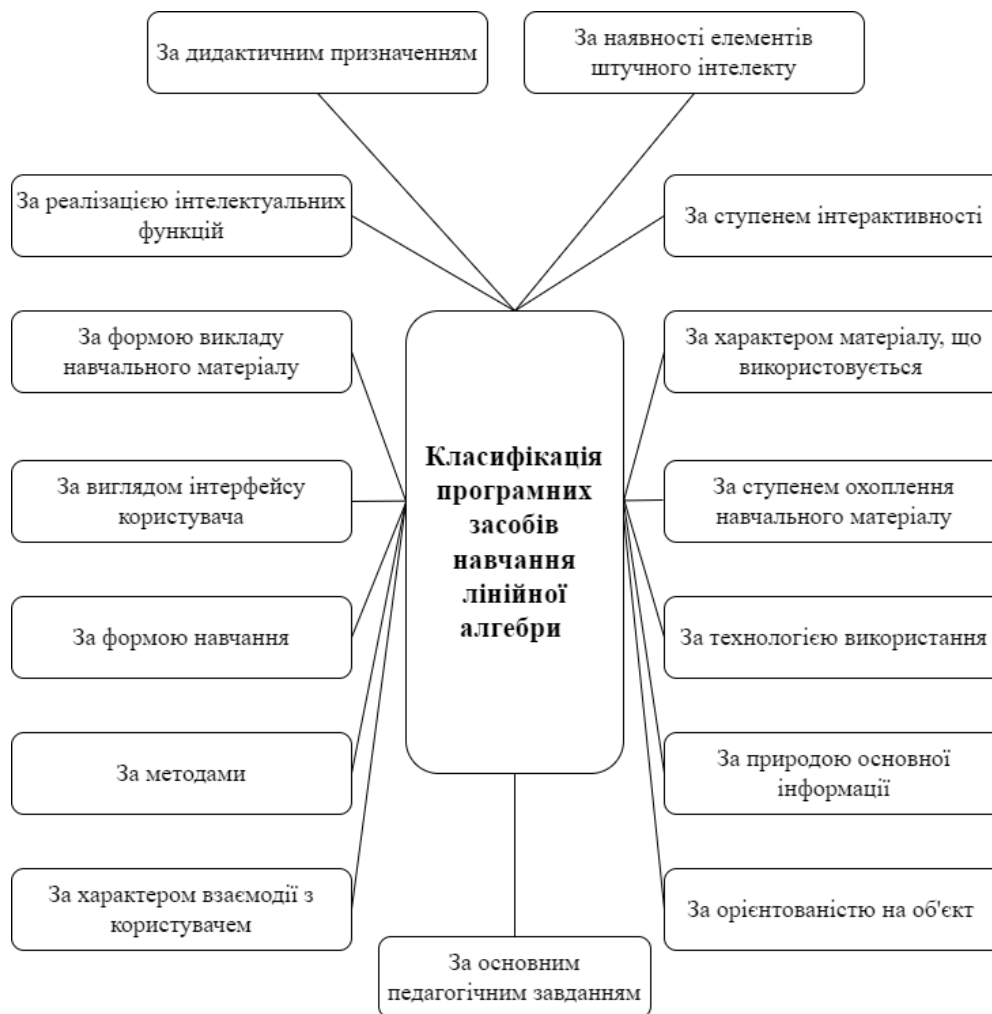
Рис. 4. Класифікація програмних засобів навчання лінійної алгебри (розроблено автором)

На основі аналізу наукових досліджень, спостереження за освітнім процесом з лінійної алгебри, практики викладання лінійної алгебри, пропонуємо авторську класифікацію засобів ІКТН лінійної алгебри, зображену на рис. 4.