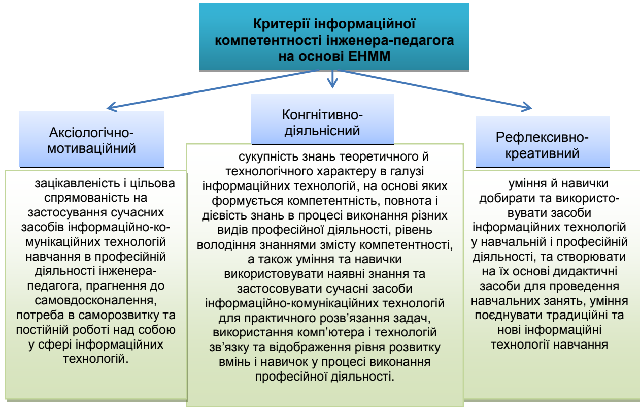
Рис. 1. Компоненти інформаційної компетентності майбутнього інженера-педагога на основі використання ЕНММ