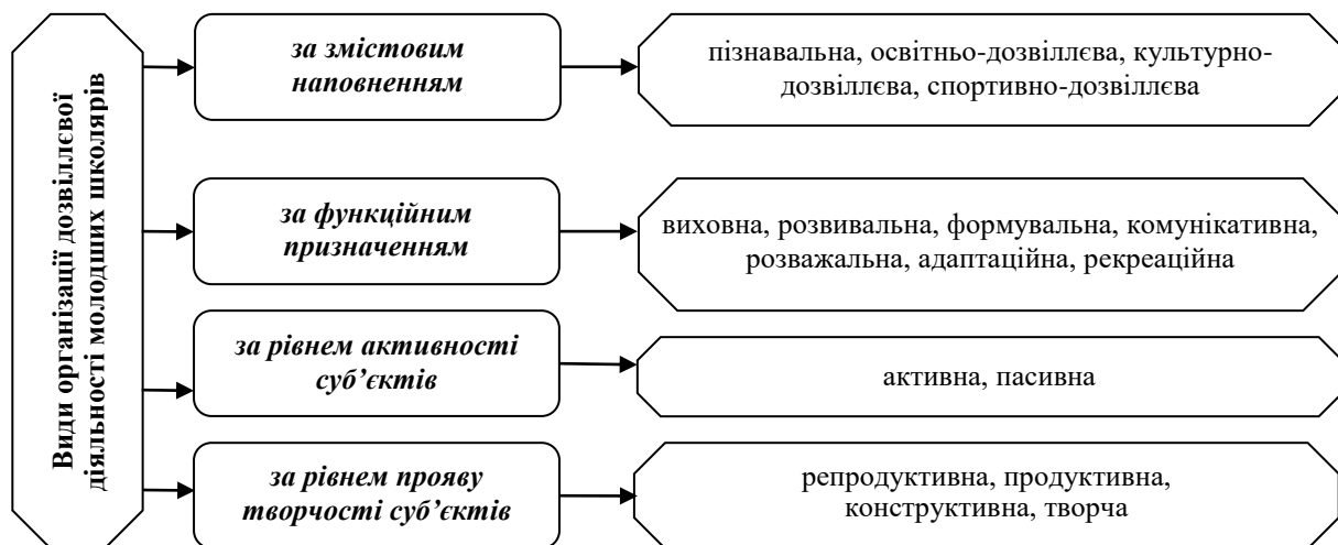
Рис. 1. Класифікація видів організації дозвіллевої діяльності молодших школярів

Таким чином, проведений аналіз засвідчив неоднозначність підходів учених до визначення видів дозвілля й дозвіллевої діяльності особистості загалом та дитячого дозвілля зокрема. На нашу думку, така нечіткість виокремлення видів дозвіллевої діяльності унеможливує продуктивне вирішення цієї проблеми. З огляду на це, для класифікації видів організації дозвіллевої діяльності дітей молодшого шкільного віку нами обрано наступні критеріальні ознаки: зміст дозвіллевої діяльності, функційне призначення, активність та рівень творчості її суб'єктів (рис. 1).