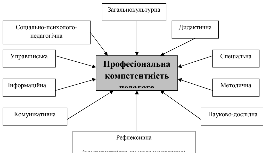
Мал. 1. Модель професіональної компетентності педагога

більш конкретних компетентностей: соціально-психолого-педагогічної, дидактичної, спеціальної, методичної, інформаційної, управлінської, науково-дослідної, загальнокультурної, комунікативної і рефлексивної (мал. 1).