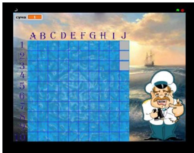
Рис. 1. Головна сторінка ігрового проекту «Фізико-математичний морський бій»