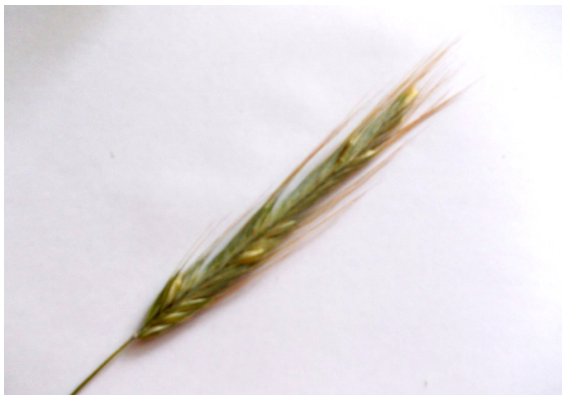
Рис. 3. Череззерниця тетраплоїдного жита сорту Верасень

Висота рослин тетраплоїдного сорту жита Верасень суттєво відрізняється від диплоїдних сортів. Ще однією із відмінних характеристик диплоїдних і тетраплоїдних сортів жита є те, що у тетраплоїдних сортів спостерігається явище череззерниці (рис. 3).