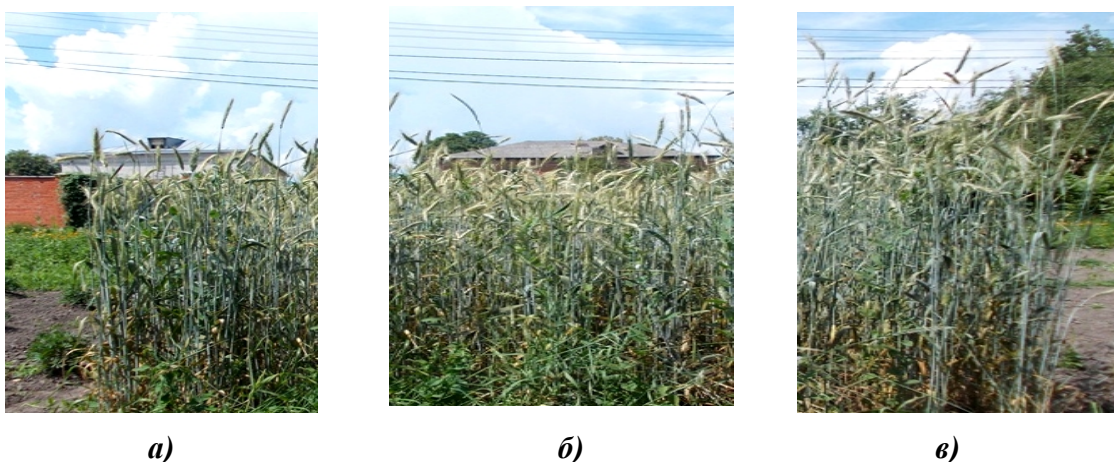
Рис. 1. Фаза дозрівання: а) сорт Інтенсивне 99; б) сорт Синтетик 38; в) сорт Верасень

Виконання першого етапу дослідження дає можливість встановити, що тетраплоїдне насіння жита сорту Верасень має більші лінійні розміри та масу в порівнянні з диплоїдним. Другий етап полягає у дослідженні періодичності росту і розвитку рослин, складанні морфологічної характеристики диплоїдних і тетраплоїдних форм жита посівного. На різних етапах фенологічного розвитку рослин проводиться морфометрія висоти рослин, довжини флагового листка, довжини колоса. Морфологічні відмінності між диплоїдними і тетраплоїдними сортами жита більш наочно демонструє висота рослин (рис. 1, рис. 2).