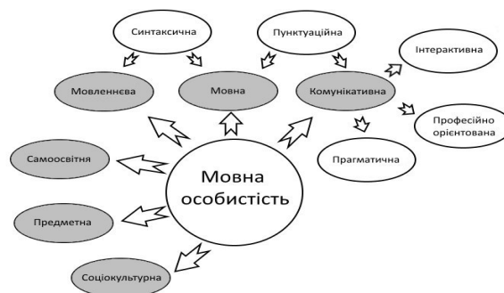
Схема 1. Компетентнісна модель мовної особистості

З огляду на проблематику нашого дослідження, пропонуємо компетентнісну модель мовної особистості: