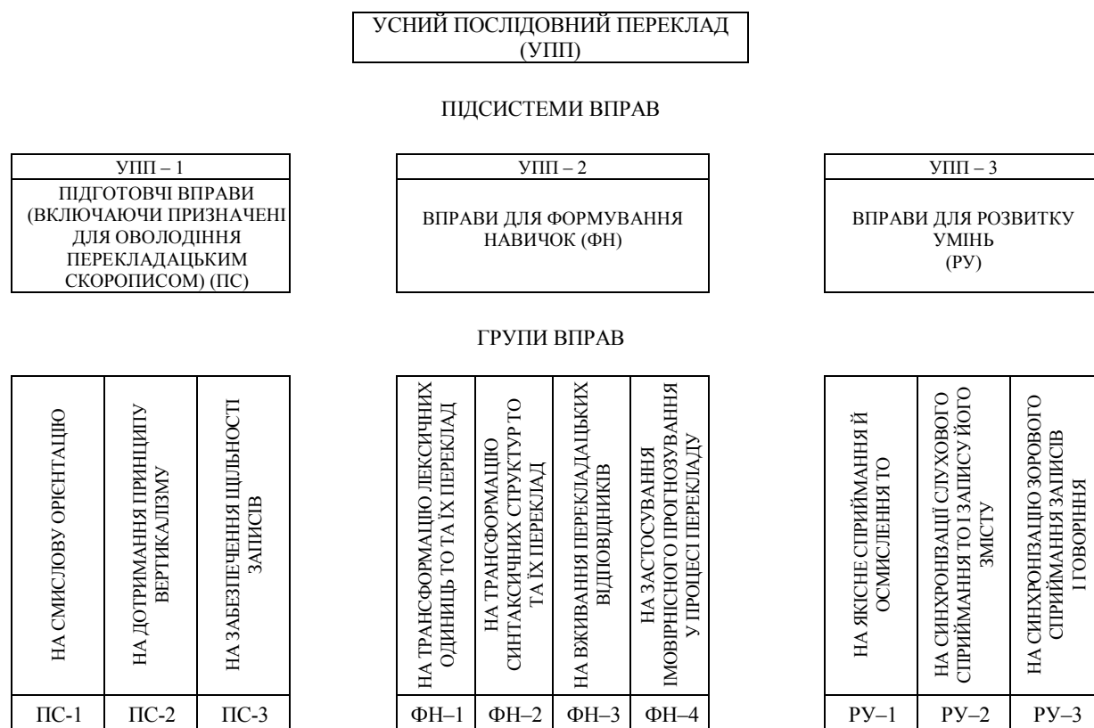
Рис. 2. Система вправ для навчання усного послідовного перекладу з опорою на перекладацький скоропис

Умовні позначення: ЕПП – еквівалентний (повний) письмовий переклад; ГВПП – гетеровалентний (частковий) письмовий переклад; УПА – усний переклад з аркуша; ПослП – послідовний переклад; АФП – усний абзацно-фразовий переклад; УПП – усний послідовний переклад; УСП – усний синхронний переклад.