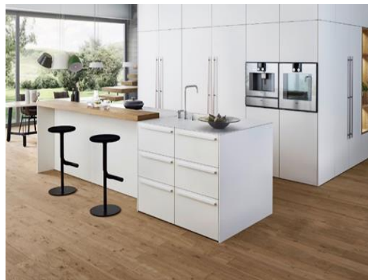
Рис. 1. Зразки сучасних кухонь, виконаних німецькими фірмами

Загалом німецькі кухні цілком заслужено вважаються національною гордістю Німеччини. Їхні виробники змогли найвдалішим чином поєднати у своїх меблях високу естетичність, довговічність, бездоганну якість і відмінну функціональність. Різні матеріали органічно поєднуються між собою так само, як і різні забарвлення. Шпонована деревина має гарний вигляд у комбінації з металом і склом, а лаковані поверхні фасадів зачаровують чистотою ліній.