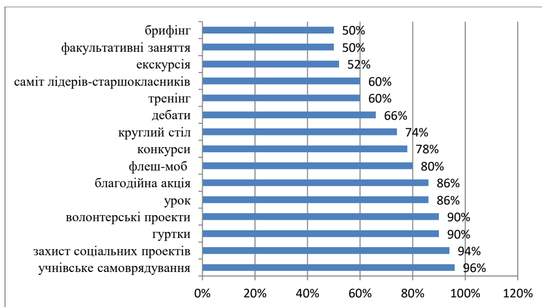
Рис. 1. Результати опитування щодо використання організаційних форм формування лідерських навичок учнів

В ході дослідно-експериментальної роботи на базі НВК 157 м. Києва було проведено опитування з метою виявлення найбільш ефективних організаційних форм і методів які вчителі використовують для формування лідерських навичок учнів. В опитуванні взяли участь 130 учителів. Розподіл відповідей показав такі результати: