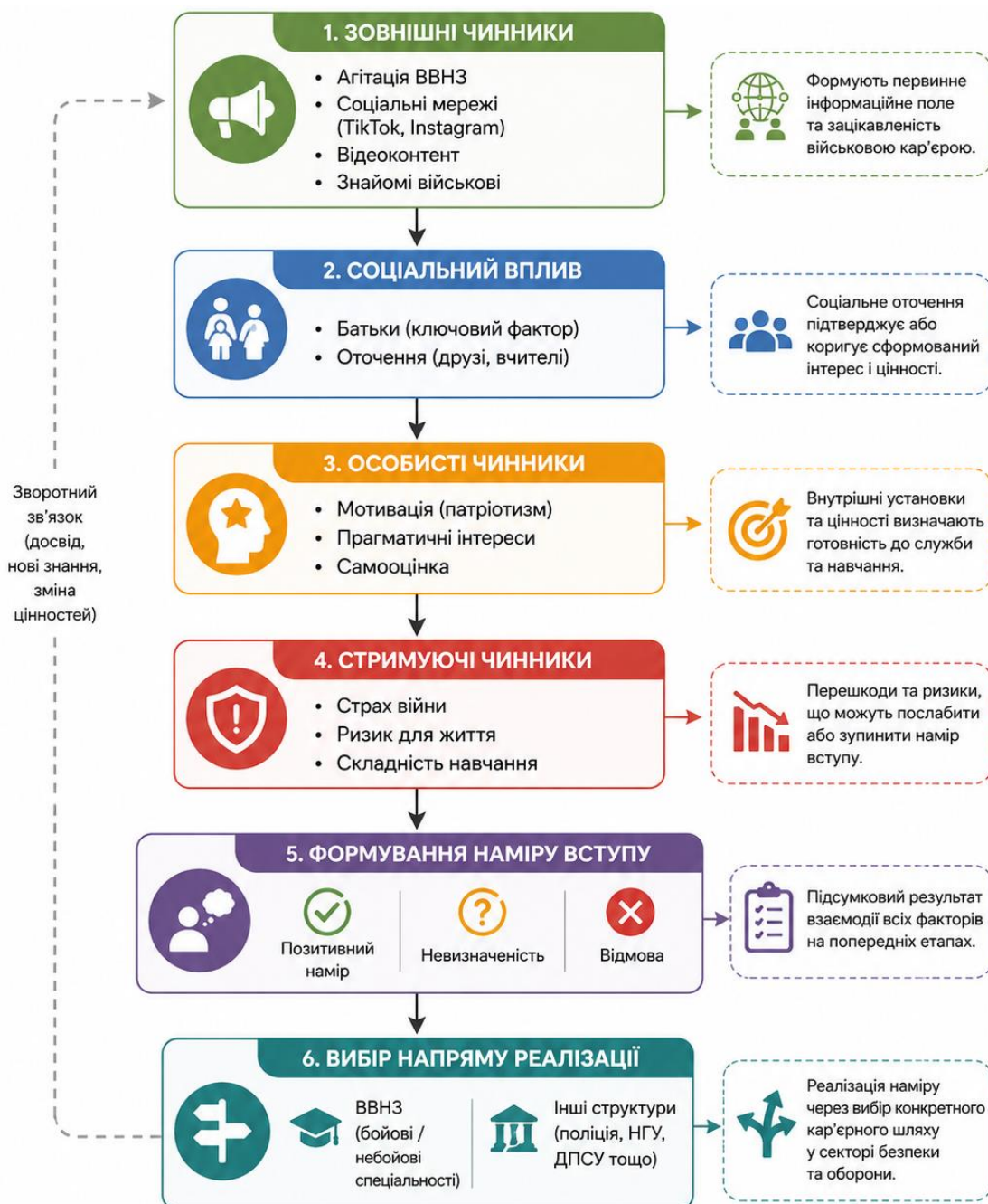
Рис. 4. Структурно-логічна модель формування наміру вступу до ВВНЗ

З метою узагальнення отриманих результатів та систематизації виявлених закономірностей було розроблено структурно-логічну модель формування намірів вступу до військових вищих навчальних закладів, яка представлена на рисунку 4.